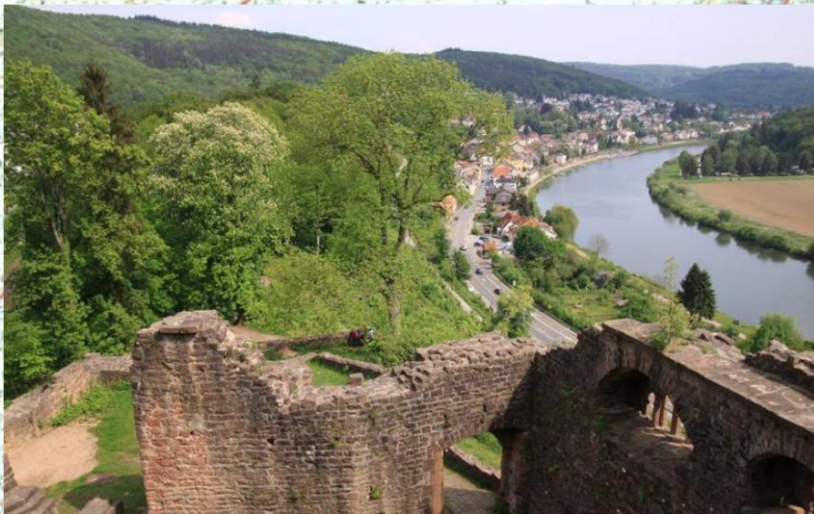
Blick von der Ruine Hinterburg auf Neckarsteinach