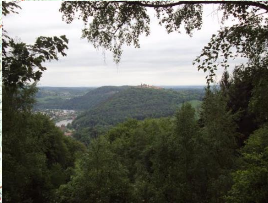
Aussicht vom Goetheblick